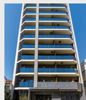
リビオレゾン三ノ輪ステーションプレミア 2021年11月竣工/総戸数38戸